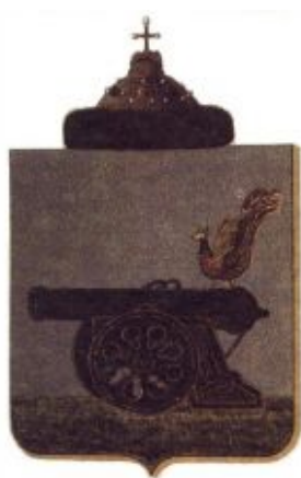
Герб Смоленского княжества: в серебряном поле щита на зеленой траве черная пушка на золотом лафете, на пушке сидит райская птица.

В гербах фамилий, относящихся к тому или иному русскому княжескому роду, обязательным элементом было изображение герба определенного княжества. Например, герб Вяземских, ведущих свой род от князя Ростислава-Михаила Мстиславича Смоленского, включает в себя герб Смоленского княжества: