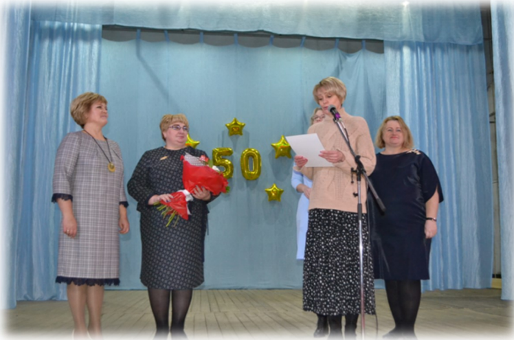
Продолжение на стр. 2

В 1929 году оба колхоза решили построить новое здание школы.